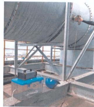
研发室排气筒出口 03#