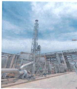
罐区一排气筒出口 06#